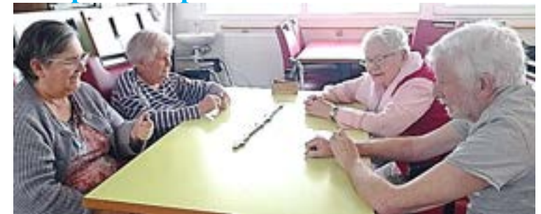
A Sainte Bernadette, les cocos de Paimpol, c'est sacré » !