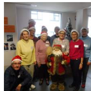
Rédaction : C. Darboux

Merci pour votre assiduité et votre investissement !