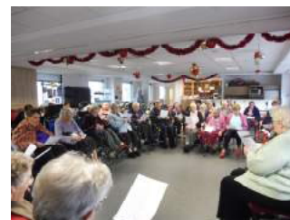
Rédaction : K. LESNE et F. LE FLOCH